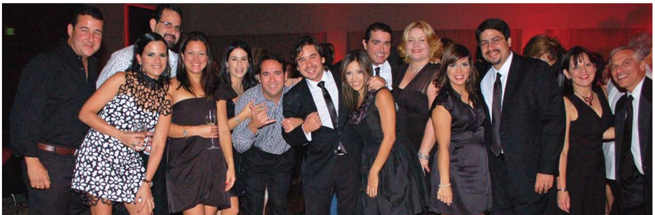
Grupo de participantes en la gala.