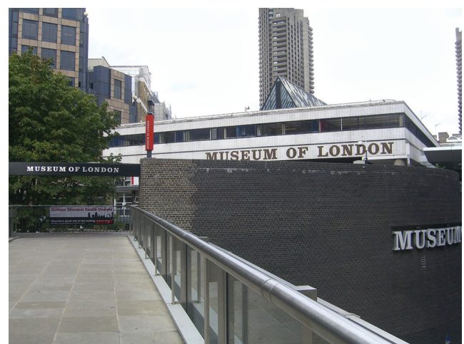
Museum of London, Infernafox, CC-BY-2.5