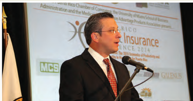
Hon. Alejandro García Padilla, Gobernador de Puerto Rico.