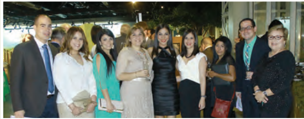
Grupo de Hematólogos–Oncólogos invitados a la actividad.