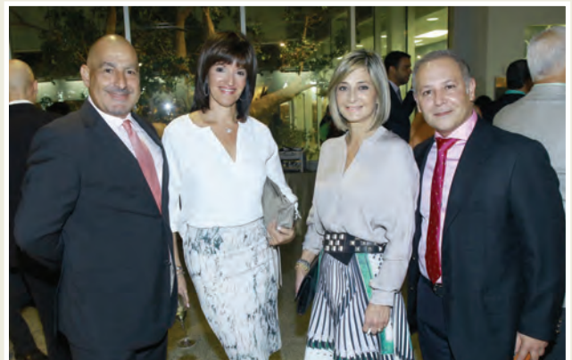
Hematólogos Oncólogos invitados.