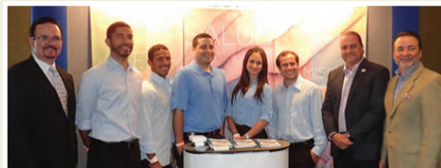
Representantes del Sistema de Salud Menonita y miembros de la directiva de AEMPR.