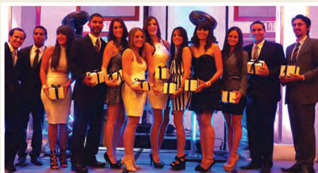
Varios de los delegados de la AEMPR.