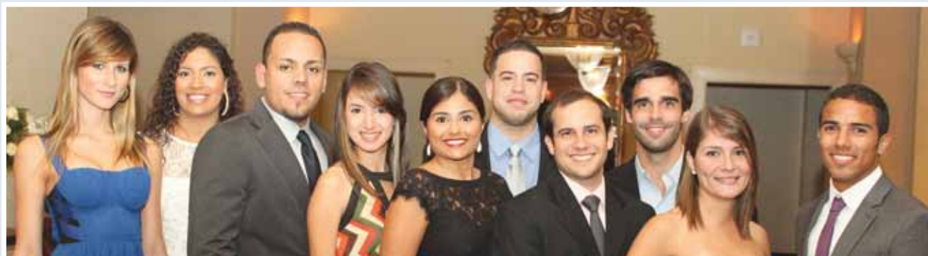
Delegados de la Asociación Estudiantes de Medicina de Puerto Rico.