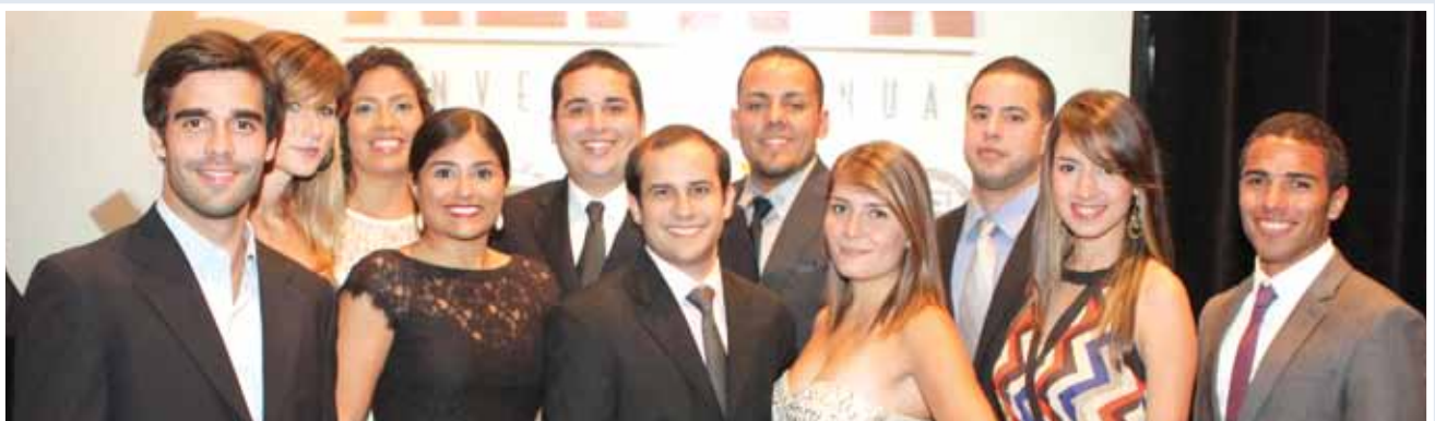
Delegados de la Asociación Estudiantes de Medicina de Puerto Rico.