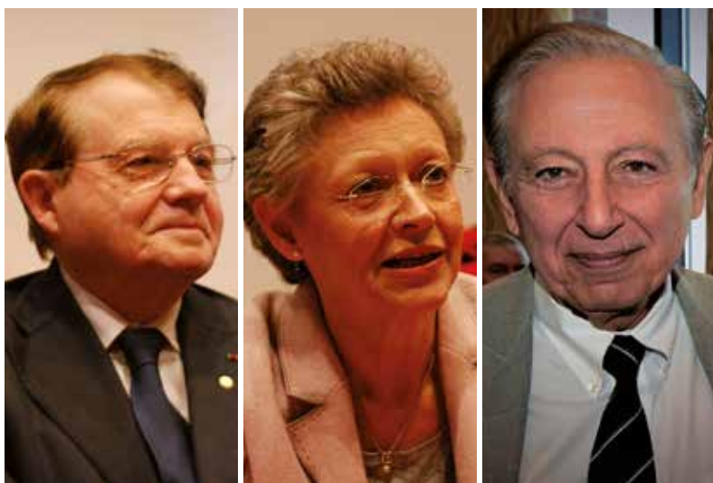
Dr. Luc Montagnier, Dra. Françoise Barré-Sinoussi y Dr. Robert Gallo.

En 1984, el grupo del Dr. Robert Gallo, del National Institute of Cancer, informó haber hallado un virus que causaba el SIDA. Se generó una controversia sobre quién descubrió el VIH. Una comisión creada en 1990 por el Departamento de Integridad Científica del Instituto Nacional de Salud concluyó que el virus de Gallo provenía del laboratorio de Montagnier, que había enviado una muestra a Gallo, y que esta muestra había contaminado un cultivo. Así, hoy se reconoce que el grupo francés fue el primero en aislar el virus VIH, pero que el grupo de Gallo demostró primero que este virus causa el SIDA. En 1987, después de diversas controversias legales, decidieron compartir patentes. En 1988, compartieron el Premio Japan y, en 2000, el Premio Príncipe de Asturias. En 2002, en dos artículos publicados en Science , Gallo y Montagnier comparten los diferentes roles que cada uno tuvo en el descubrimiento del virus de VIH.